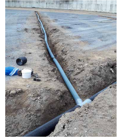
Drainage de la pelouse synthétique du stade du Colombier.