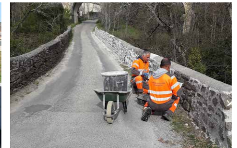
Réfection du parapet du pont des Chiffaux.