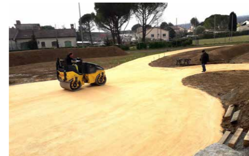
Travaux et végétalisation du stade de la Mûre.