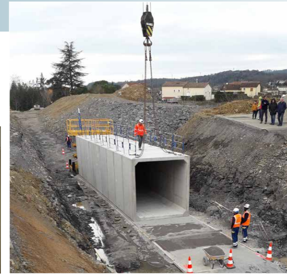
Voie Douce : tunnel de passage sous la RD153.