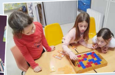
Des jeux avec la ludothèque du Palabre.