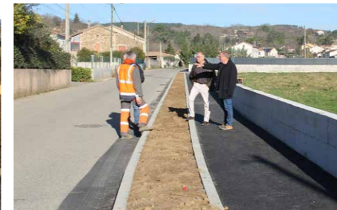
Travaux de sécurisation de la route des Champs.