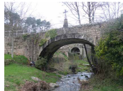
Le pont de Gaude