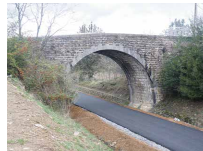
Le pont de la Roche

19 ponts, selon des critères prédéfinis, ont été retenus et ont fait l'objet d'une inspection sur le terrain. Les conclusions du CEREMA nous seront remises ultérieurement.