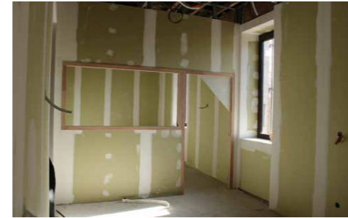
Travaux de réhabilitation du presbytère (Accueil).