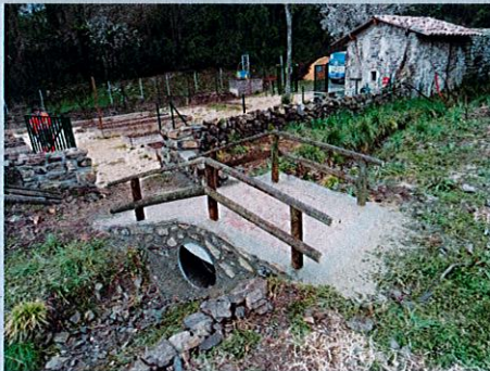
Aménagement d'une passerelle dans le jardin pédagogique.